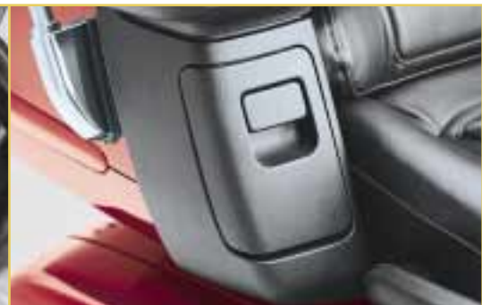
Luxus auch auf dem hinteren Platz: die praktische Ablage für den Mitfahrer.