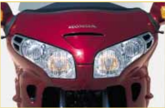
Die Scheinwerfer sind elektrisch verstellbar.