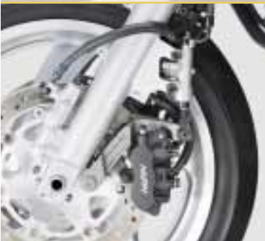
Höchstleistungen auch beim Bremsen. Die Bremszangen des Dual-CBS verfügen über jeweils 3 Bremskolben.