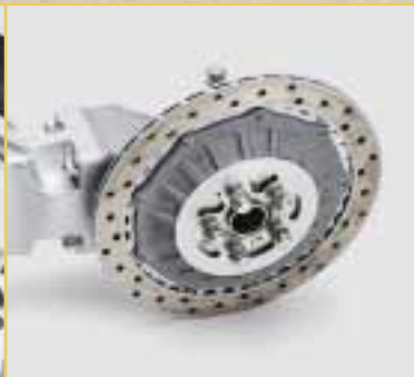
Die innenbelüftete hintere Brems-scheibe in der Detailsicht.