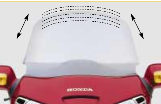
Verkleidungsscheibe 6-fach verstellbar.