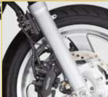
Das Verzögerungsventil verringert das Eintauchen beim Bremsen mit der Fußbremse.