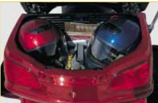
Das 61-Liter-Stauvolumen des Top Case kann bei Verzicht auf einen CD-Wechsler (optional) um weitere 5 Liter erhöht werden.

Der Luxustourer, der keine Wünsche offen lässt. In den großzügig dimensionierten Koffern mit insgesamt 147 Liter Stauraum findet das Gepäck auch für längere Touren Platz. Dabei sorgen hydraulische Dämpfer an den Öffnungsklappen der Seitenkoffer für einfaches Bepacken und mit den optional erhältlichen Innentaschen wird das Be- und Entladen denkbar einfach. Schöner Komfort: Mittels Fernbedienung können die Kofferschlosser entriegelt und das Top Case geöffnet werden. Die neue Honda Gold Wing. So schön können Motorradtouren sein.