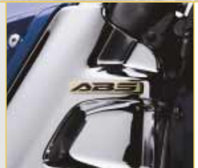
ABS ist bei der Gold Wing natürlich serienmäßig.