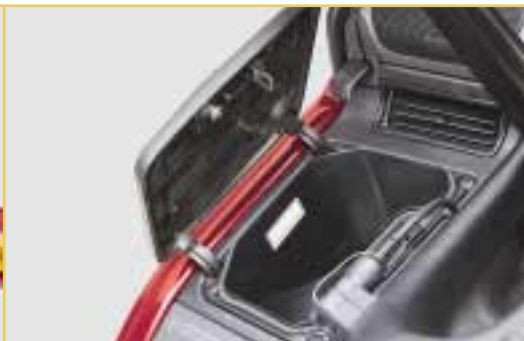
Von den beiden praktischen Staufächern ist eines abschließbar.