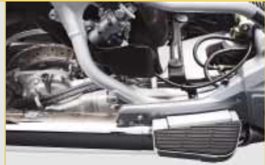
Über ein elektro-hydraulisches System lässt sich die Federvorspannung des hinteren Federbeins per Knopfdruck verstellen.