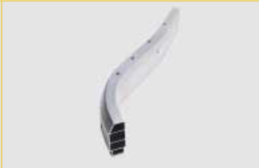
Verstärkungsstege im Rahmenhauptrohr erhöhen die Steifigkeit.