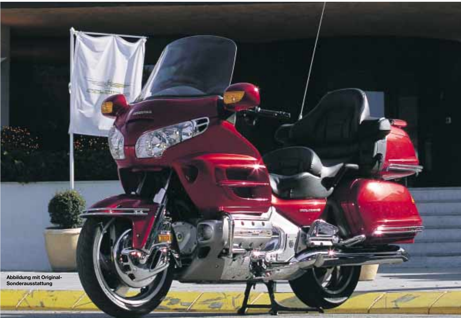
Abbildung mit Original-Sonderausstattung