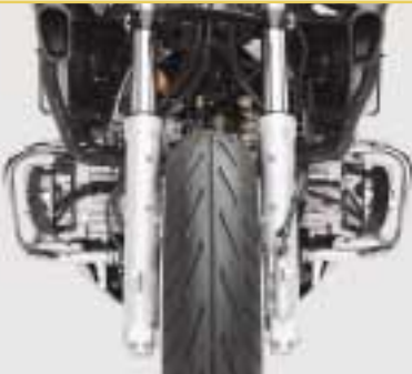
Die 45-mm-Teleskopgabel mit Eintauchverzögerung ist extrem verwindungssteif.