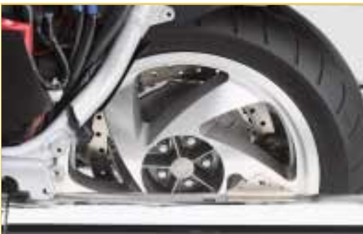
Der Ausbau des Hinterrades wird durch die Einarmschwinge zum Kinderspiel.

Darüber hinaus sorgen die neue Pro-Arm-Einarmschwinge mit Pro-Link-System und die elektronisch gesteuerte Federvorspannung mit Memory-Funktion an der Hinterradaufhängung für optimalen Fahrkomfort in allen Situationen.