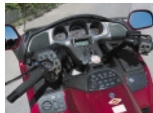
Auch im Cockpit gibt sich die Honda Gold Wing gediegen.

Montage eines Tankrucksacks ist aber konstruktionsbedingt nicht möglich. Die zulässige Zuladung von 209 Kilogramm ist tourengerecht.