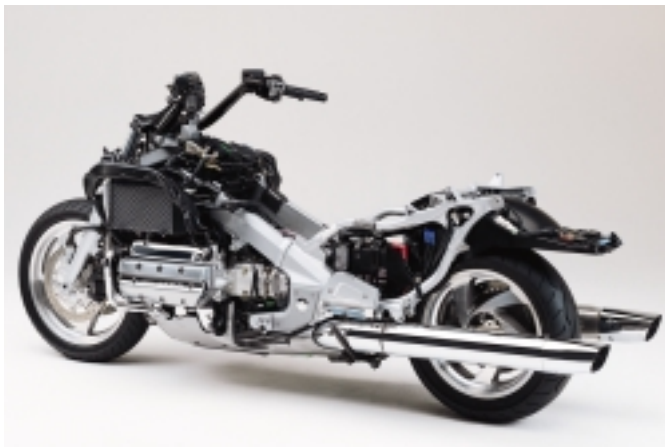
Der Sechszylinder-Boxermotor misst nun 1832 Kubikzentimeter Hubraum. Der neue Leichtmetall-Kastenprofilrahmen ist mit verantwortlich für das vergleichsweise geringe Gewicht der Gold Wing.

das, einmal im Rollen, mit reichlich Schmackes. Bereits ab Standgas bittet die Gold Wing zum Drehmomentanz . Egal, in welchem Drehzahlbereich die Gashand schwach wird, stets gibt's Dampf ohne Ende. Da passiert es leicht einmal, dass die GL nicht artgerecht in Superbike-Manier über kleinste Landstraßen gejagt wird. Das Thema Laufkultur behandelt der Sechser dabei wie ein Musterschüler. Vibrationen sind Mangelware.